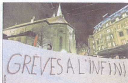
«Notre mouvement de pression doit se poursuivre», appelle Aristides Pedraza, de SUD.

Un système qui a sans doute un avenir. Selon une étude de SuisseEnergie, plus de 2 000 000 de kWh/an d'énergie thermique pourraient être récupérés en Suisse avec les eaux usées. Soit le besoin en eau chaude de 900 000 personnes! ■